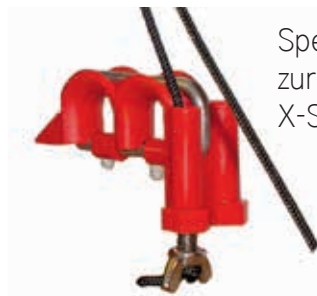
Spezialschraube zur Einstellung des X-Streams